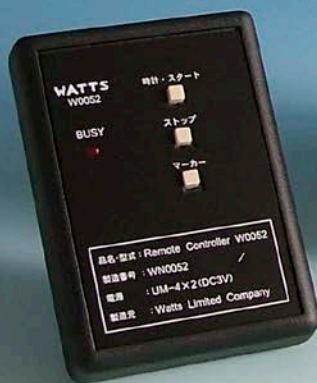
リモートコントローラ／W0052